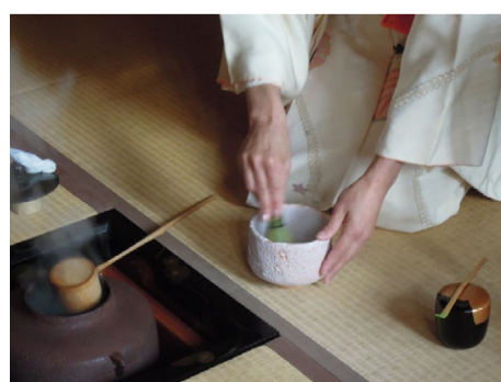
L'art du Chanoyu