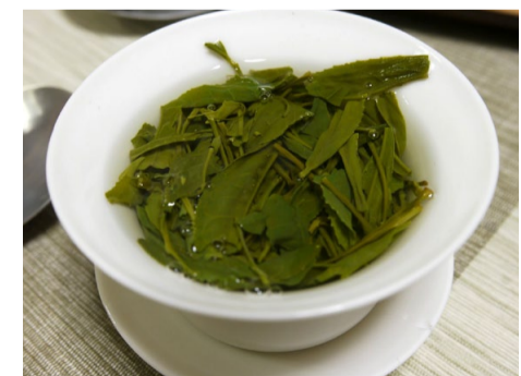
Sencha de Tamakawa infusé