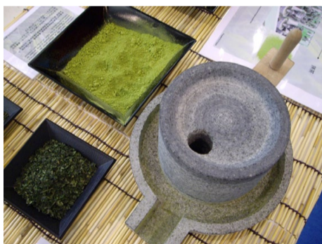
Mouture du Tencha en Gyokuro