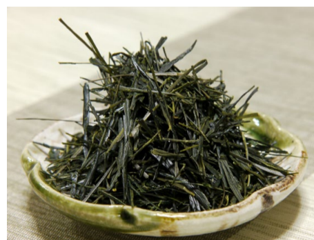
Sencha de Tamakawa (Honyama)