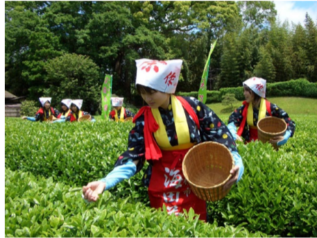
Cueillette manuelle des bourgeons de la 1 er récolte pour les thés haut de gamme