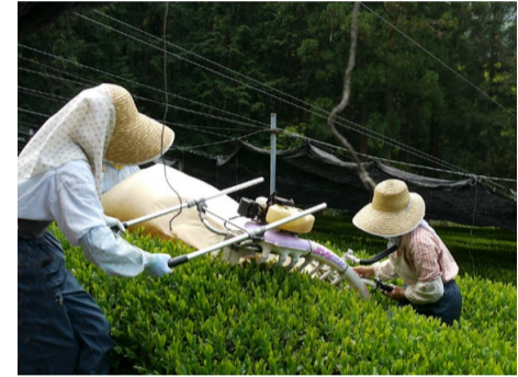
Cueillette mécanique et récoltes multiples pour le tout venant